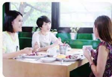
5) 孩子要贏在起跑線?