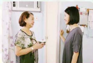
9) 上一代參與照顧嬰孩必起衝突?