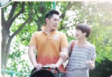
1) 產後媽媽會出現情緒困擾?